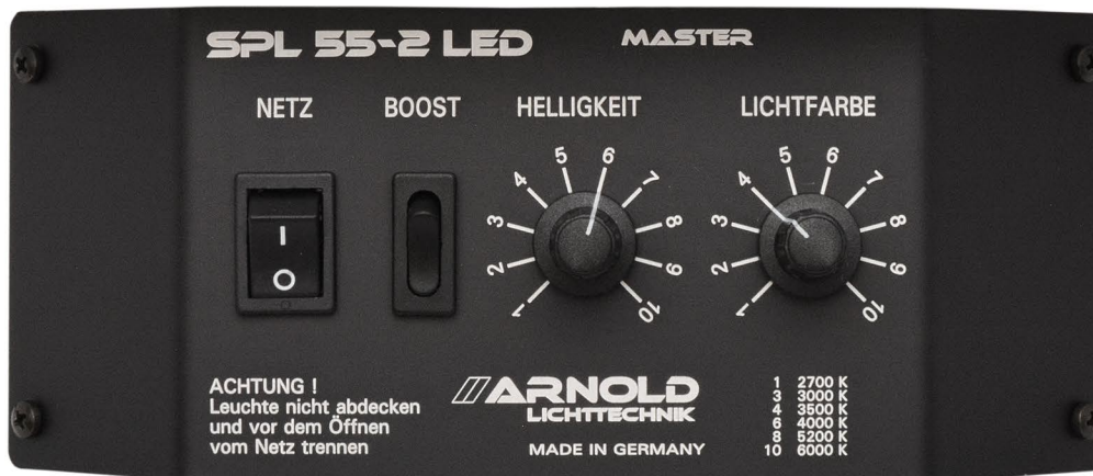
Bedien- Panel der Master- Leuchte