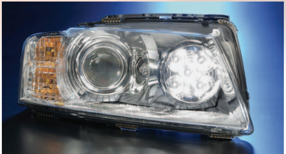
Bild 1: Audi A8 Scheinwerfermodul. Rechts Tagfahrlicht bestehend aus fünf Weißlicht-LEDs mit Reflektor. Links konventioneller Xe-Scheinwerfer. Auch LED-Scheinwerfer befinden sich derzeit bereits in der Erprobung

Mit stärkeren Lichtausbeuten und höherenergetischen („blauerer“) Spektren der LEDs stoßen heute einige Systeme in Bereiche vor, die potentiell augengefährlich sein können. Erstmals die Version der