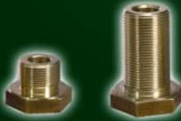
Messingschrauben 548-131 und 548-132