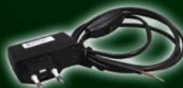
Netzteil mit Konstantstrom- quelle 350 mA für Variante Festmontage 543-107