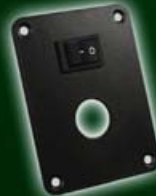
Adapterplatte 5 mit Schalter 548-115