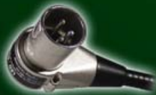
Leuchte mit Winkelstecker 551-021 und 022