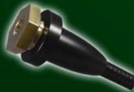
Messingschraube und Beilagering montiert