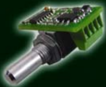
Dimmer LC-PWM 324 (OEM-Version) 547-002