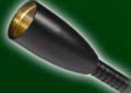
Leuchte ohne Stecker für Festmontage 551-061 bis 064