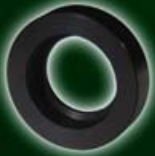
Beilagering für Festmontage 548-122