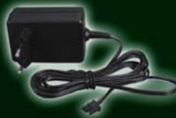
Steckernetzteil 12V für XLR 543-102