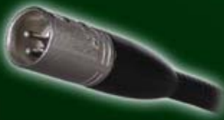
Leuchte mit XLR Stecker gerade 551-001 bis 004