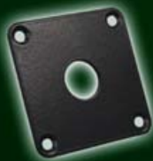
Adapterplatte 3 für Festmontage 548-113