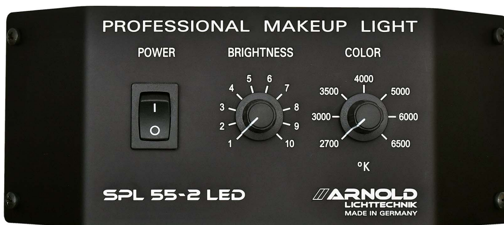
Bedien- Panel der Master- Leuchte