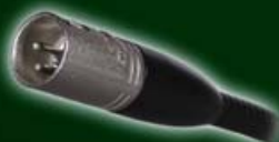
avec prise XLR droite 555-001 à 004