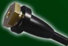
Vis en laiton et rondelle de calage montée