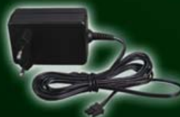
Adaptateur secteur 12 V 543-102