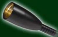
sans prise pour montage à demeure 555-061 à 064