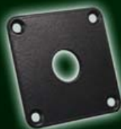
Adapterplatte 3 für Festmontage 548-113